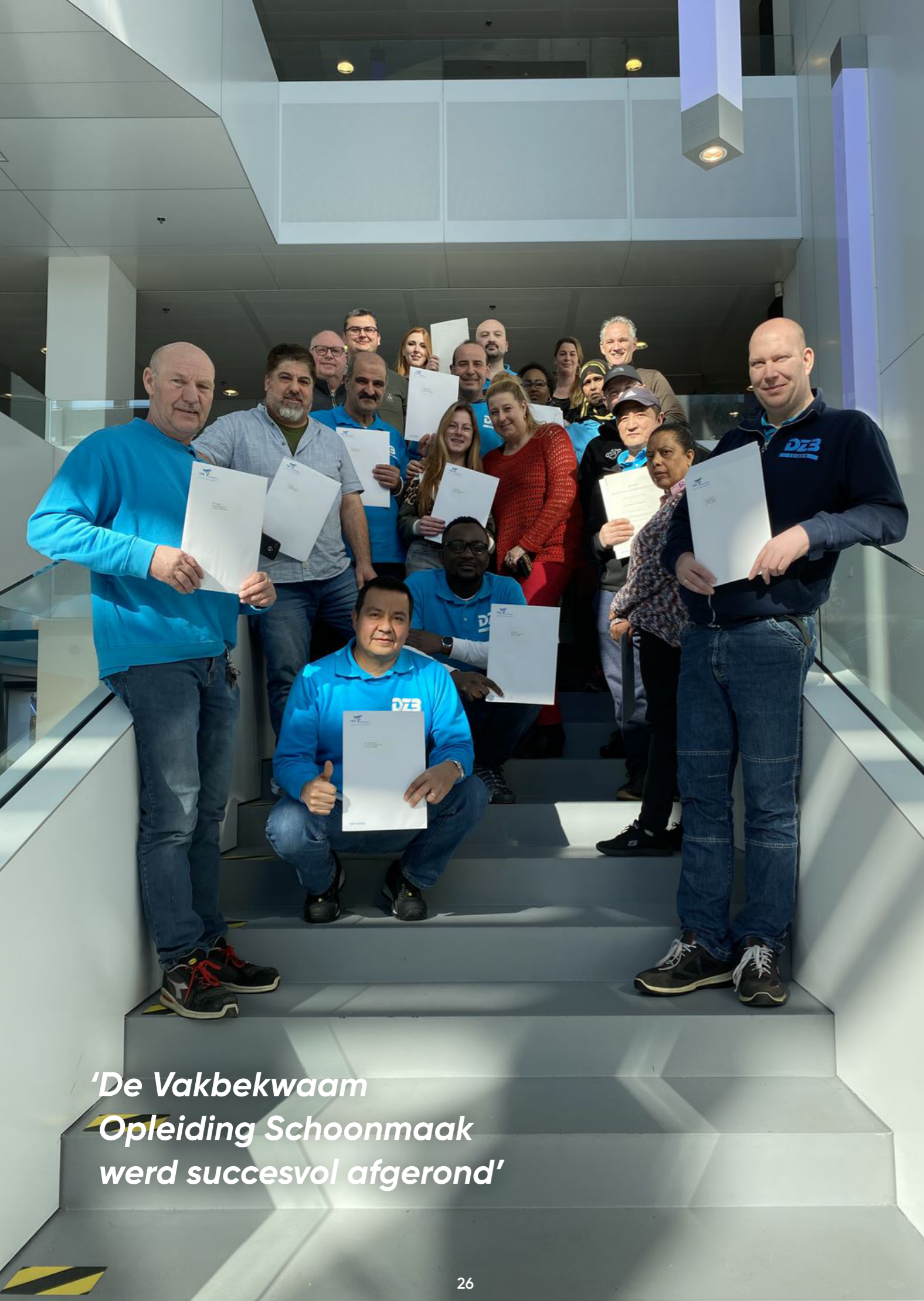
'De Vakbekwaam Opleiding Schoonmaak werd succesvol afgerond'